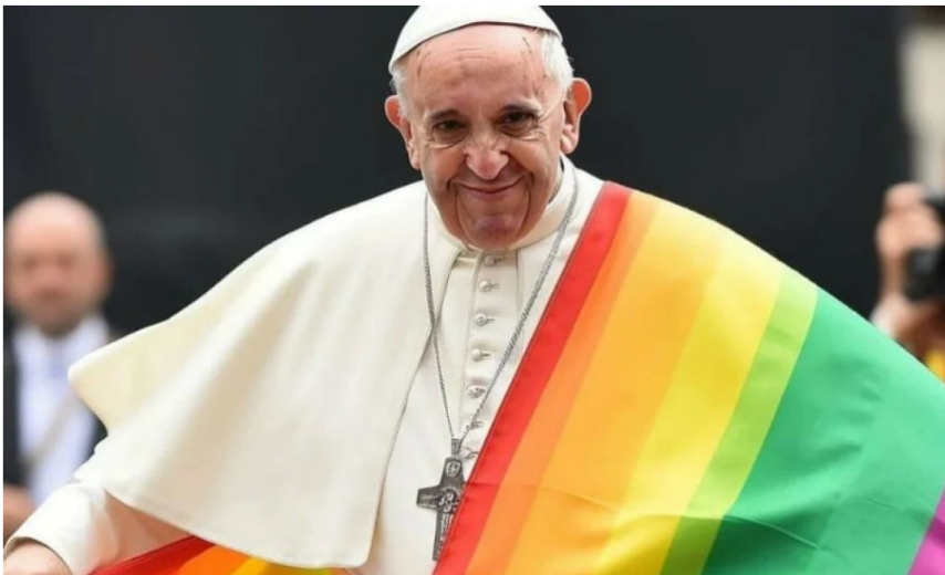
Pápež František

Pápež František sa stretol s tvrdým odporom černošských kresťanských vodcov po schválení požehnanie homosexuálnych párov, informuje portál Breitbart.